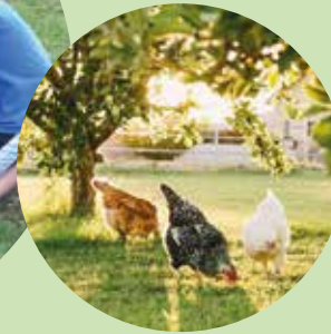
Une opportunité de restauration scolaire bio et locale