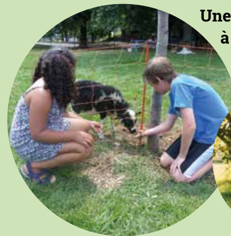
Une ferme pédagogique à proximité des écoles