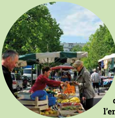
Une production alimentaire de proximité respectueuse de l'environnement