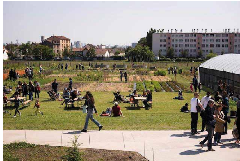
Zone sensible-Ferme urbaine de Saint-Denis

Tout est encore possible si, nous, habitants du Plateau Est nous mobilisons.